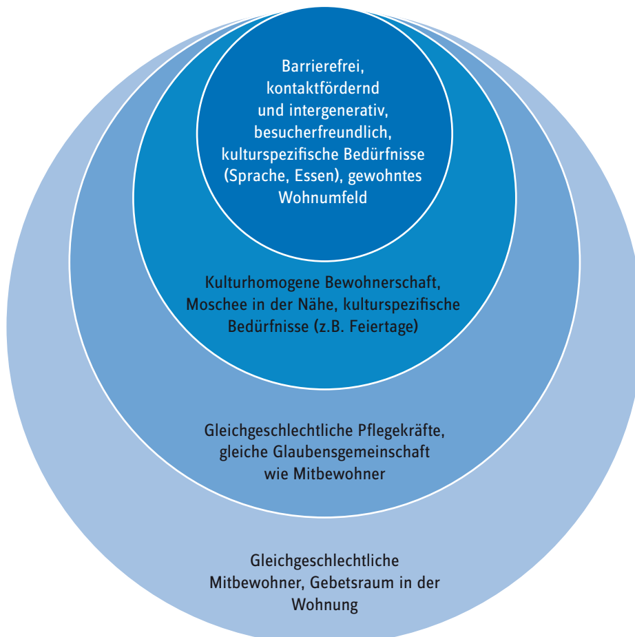
Abb. 2 Zentrale Wohnbedürfnisse älterer Türkeistämmiger jenseits der eigenen Wohnung

Autorenschaft: Rukiye Bölük, Stiftung Zentrum für Türkeistudien und Integrationsforschung, Christoph Bräutigam, Michael Cirkel, IAT - Institut Arbeit und Technik der Westfälischen Hochschule Gelsenkirchen Bocholt Recklinghausen