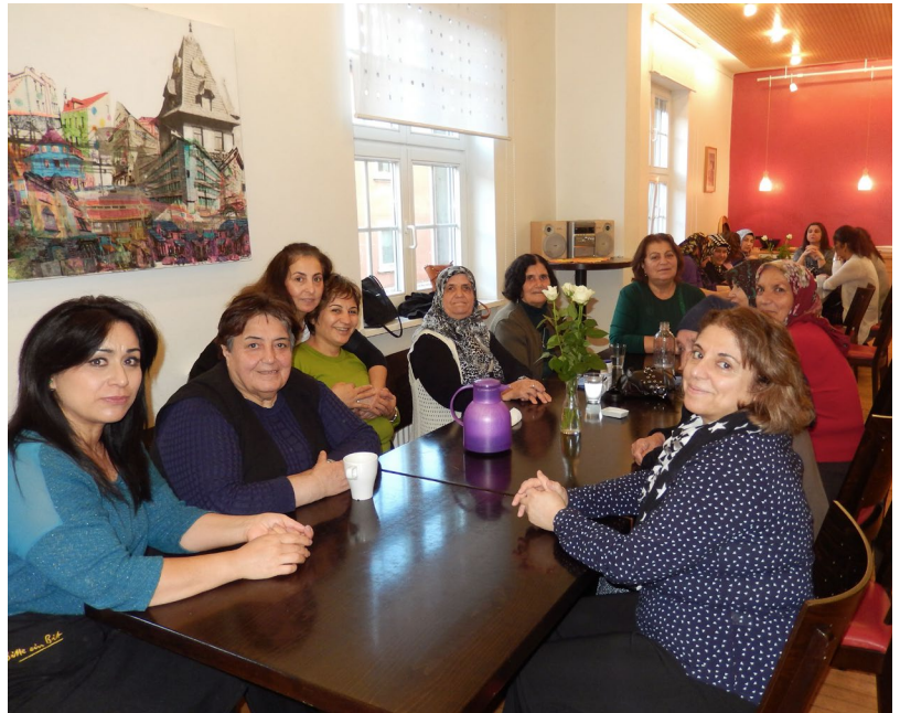
Stadtteihelferinnen und türkische Seniorinnen im Interkulturellen Stadtteiltreff

Aktuell wird „Betreutes Wohnen zuhause in Brebach“ in unterschiedlichen Haushalten erprobt. Die Pflege- und Unterstützungsangebote werden gemeinsam mit den Kooperationspartnern erbracht und orientieren sich an den individuellen Bedarfen. Der Projektträger übernimmt die Koordinierung der Leistungen (Case-/Care-Management) und ist Ansprechpartner für Haushalte, professionelle Dienstleister sowie ehrenamtliche Hilfen. Zusätzlich werden Ansprüche auf finanzielle Leistungen der Altenhilfe, Sozialhilfe etc. geprüft und zugänglich gemacht.