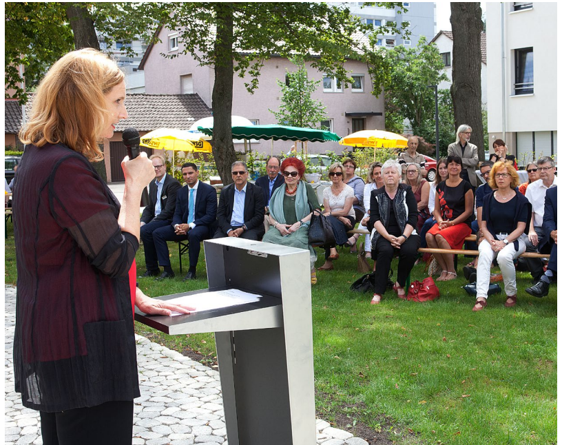
Einweihungsfeier der Wohngemeinschaft am 29.07.2016

In regelmäßigen Treffen besprechen die Angehörigen und der Pflegedienst unter fachlicher Anleitung das Leben in der Wohngemeinschaft und tauschen sich über die Bedürfnisse der Bewohnerinnen und Bewohner und deren Alltag aus. Auch mit dem Thema „Sterben“ mussten sich die Beteiligten bereits befassen. Die fachliche Unterstützung durch die Demenz Support gGmbH ist dabei sehr wertvoll.