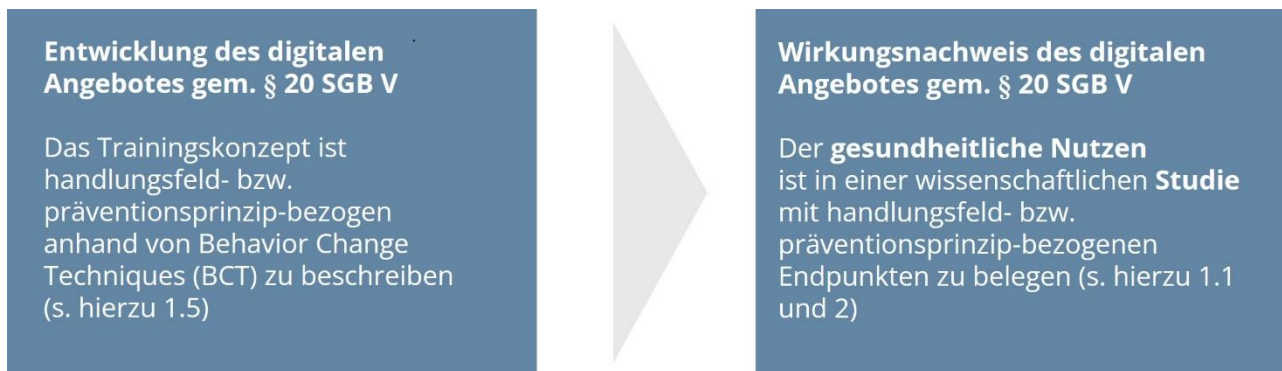
Abbildung 1: Trainingskonzept und Beleg des gesundheitlichen Nutzens

Die Zertifizierung erfolgt im Rahmen eines zweistufigen Prozesses: