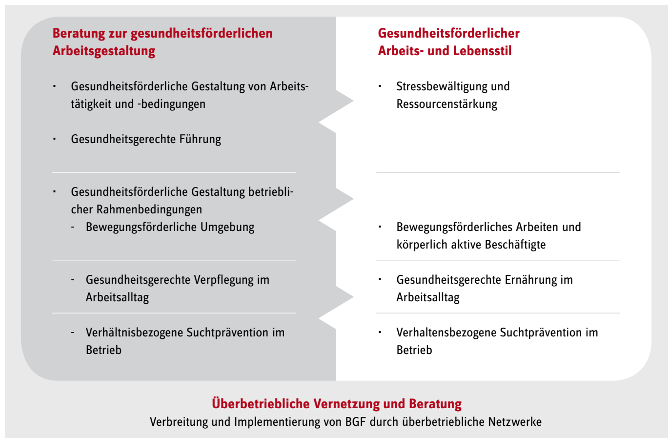
Abb. 8: Handlungsfelder (rot) und Präventionsprinzipien (Aufzählungspunkt) in der betrieblichen Gesundheitsförderung