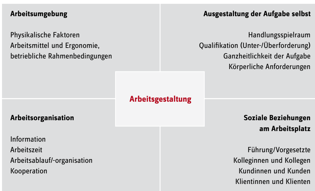
Abb. 9: Beratung zur gesundheitsförderlichen Arbeitsgestaltung (Themen)